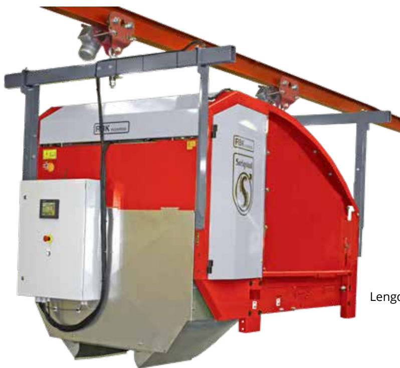
Kort modell Lengde: 2,4m | Volum: 2,8m 3